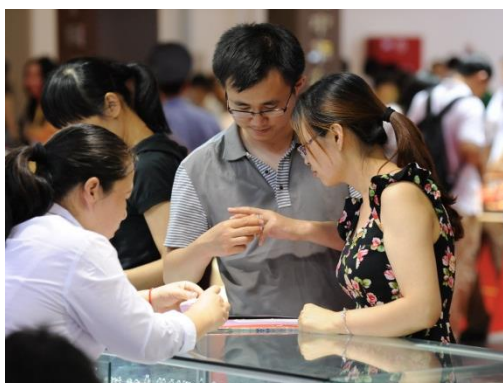
中国铂金婚庆首饰市场发展强势

(2015 年 3 月 XX 日, 上海) 国际铂金协会 PGI®于伦敦发布了《2014 全球铂金首饰零售趋势报告》。报告信息来源于占铂金首饰需求 92% 的四大重点市场——中国、日本、美国和印度, 收集了各国主要零售商的销售数据同时了解行业伙伴对铂金首饰整体趋势的看法。报告显示 2014 全球铂金首饰零售总量与去年持平表现平稳。作为全球铂金首饰的第一消费大国, 中国贵金属首饰市场因多重外部因素影响受到一定程度的波及, 在整体宏观经济增速放缓、黄金市场大幅受挫的环境下, 铂金首饰零售总量下跌 3%, 整体中国铂金首饰需求仍呈现稳健趋势, 其中铂金婚庆首饰需求依然强劲, 而铂金镶嵌类首饰更是表现抢眼增长长达 11%。此次中国报告囊括了四大零售商类型, 收集了近 70 家零售商, 超过 8000 家门店的销售数据, 旨在与行业伙伴分享铂金市场走向, 挖掘更多市场机遇。